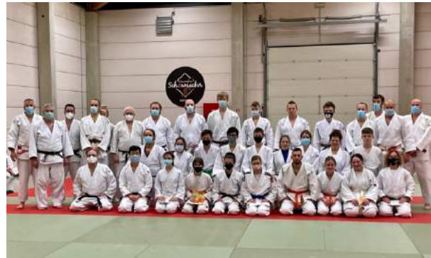
Premier cours décentralisé de Blégny 08/02/22