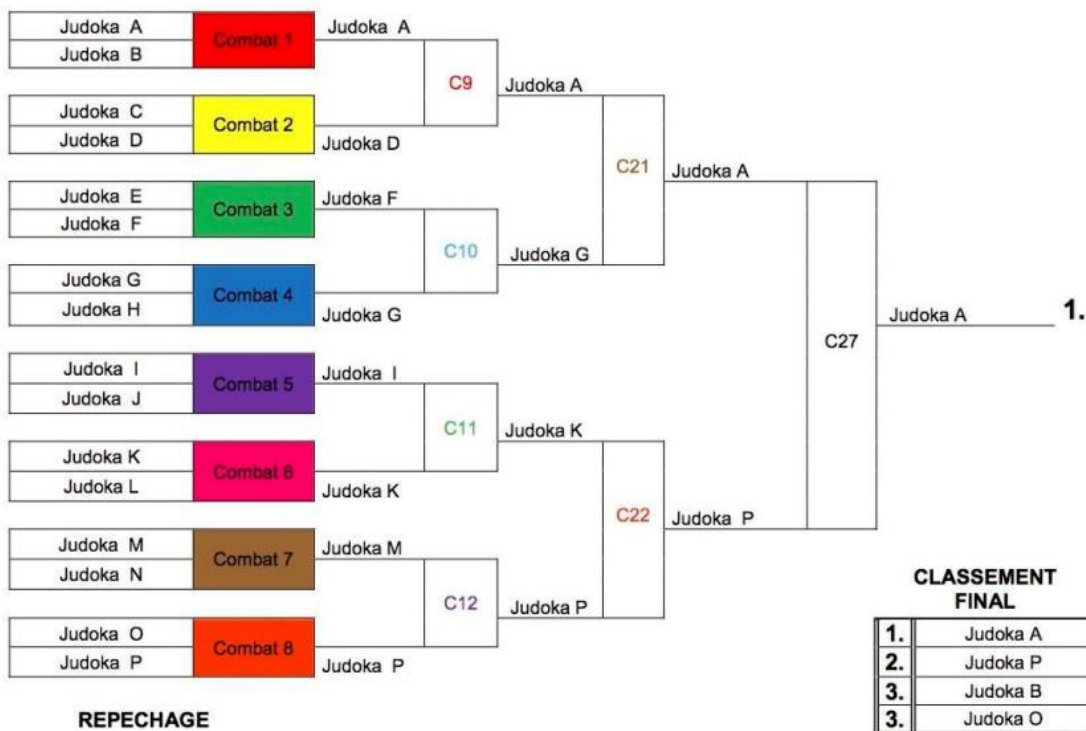
Tableau double KO